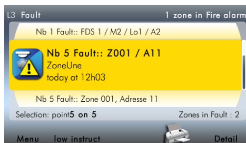
Visualisering van storing