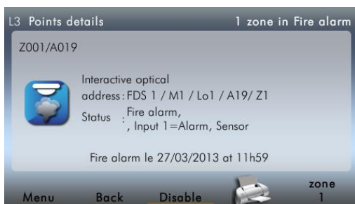
Details betreffende een punt