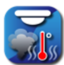
Gecombineerde detector (rook en temperatuur)

Het vertonen van afbeeldingen samen met de bijgeleverde informatie zorgt ervoor dat het bedoelde toestel onmiddellijk herkend kan worden: